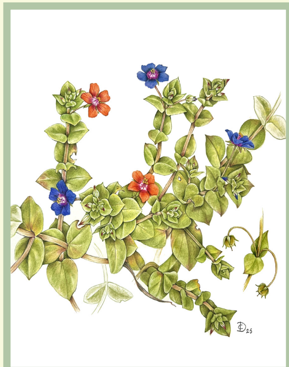
Illustrazione della specie nel suo complesso.