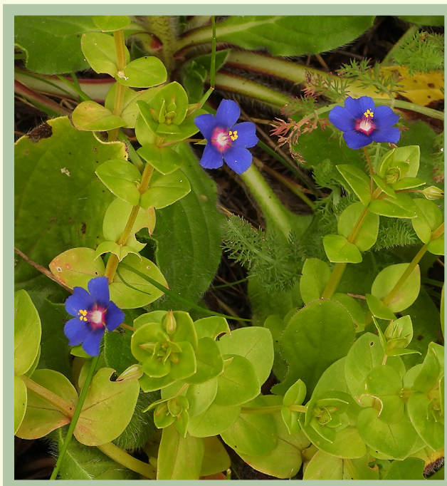
Lysimachia arvensis a fiori blu.

CURIOSITÀ: il fiore, nella variante rosso-arancio, è quello che compare nel ciclo di romanzi "la Primula rossa" di Emma Orczy. In passato era utilizzata come una sorta di barometro per la caratteristica dei fiori che si aprono col tempo soleggiato e si chiudono col tempo brutto e umido.