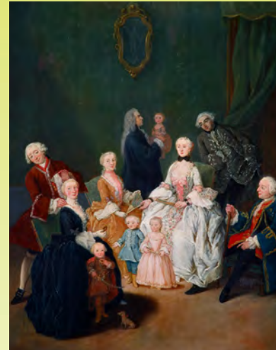
L'enfasi barocca suggeriva di caricare i tratti dell'aspetto con rossetto sulle guance e sulle labbra, di mettersi gonfie parrucche, ciglia finte fatte con peli di talpa e di dipingersi le sopracciglia con inchiostro di china (dipinto di Pietro Longhi).